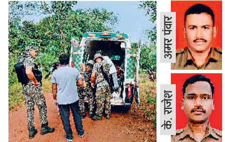
हरिभूमि न्यूज ►► जगदलपुर/नारायणपुर

2 करोड़ 62 लाख के इनामी ये 38 नक्सली इसी महीने की शुरुआत में अबूझमाड़ में फोर्स को बड़ी सफलता मिली थी। जिसमें 2 करोड़ 62 लाख के इनामी 38 नक्सलियों को मार गिराया गया था। पुलिस के लिए बड़ी सफलता इसलिए भी है, क्योंकि इस हमले में फोर्स को किसी भी तरह का नुकसान नहीं हुआ। इसमें 25 लाख की इनामी नीति भी मारी गई, जिस पर 60 से अधिक वारदातें, जिसमें आमजन और जवानों की हत्या का मामला विभिन्न थानों में दर्ज है।