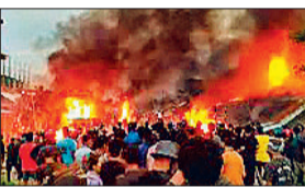
पुलिस और उग्रवादियों के बीच मुठभेड़ : सीआरपीएफ और पुलिस कर्मियों ने जवाबी कार्रवाई की, जिसके बाद दोनों के बीच भारी गोलीबारी हुई। अतिरिक्त सुरक्षा बलों को घटनास्थल पर भेजा गया। हिंसा मड़कने के बाद सुरक्षा बलों द्वारा बुजुर्गों, महिलाओं और बच्चों को सुरक्षित स्थानों पर ले जाया जा रहा है।

मणिपुर में हिंसा थमने का नाम नहीं ले रही है। राज्य में शनिवार ताजा हिंसा भड़क उठी। यहाँ पर उग्रवादियों ने जिरिबाम जिले के एक गांव पर हमला कर दिया। अधिकारियों ने बताया कि अत्याधुनिक हथियारों का इस्तेमाल करते हुए आतंकवादियों ने सुबह करीब पांच बजे बोरोबेकरा पुलिस थाने के आसपास के गांव को निशाना बनाकर गोलीबारी शुरू कर दी। उग्रवादियों ने बम भी फेंके। हालांकि इस घटना में किसी के हताहत होने की खबर नहीं है। बता दें कि हिंसा की यह घटना ऐसे समय में हुई है, जब कुछ दिनों पहले ही नई दिल्ली में मैटैड और कुकी समुदायों के विधायकों के बीच चल रहे संघर्ष का शांतिपूर्ण समाधान निकालने के लिए बातचीत हुई थी।